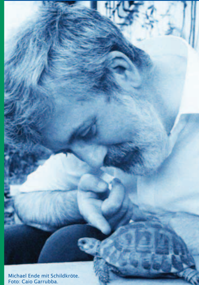
Michael Ende mit Schildkröte.

Eine gemeinsame Ausstellung des Heinrich-Heine-Instituts, des Düsseldorfer Marionetten-Theaters und der Labyrinth- Gesellschaft für phantastische und visionäre Künste e.V.